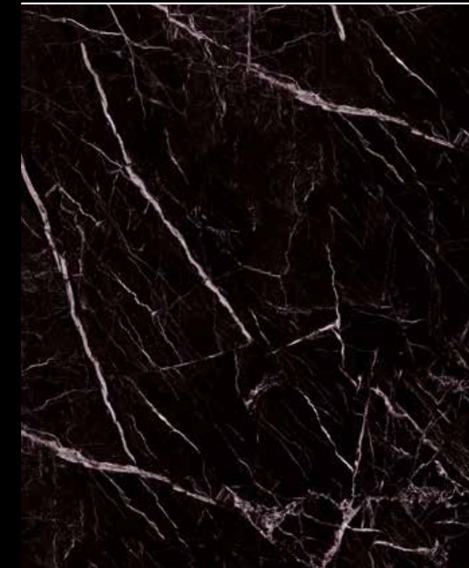
Infinite # K103