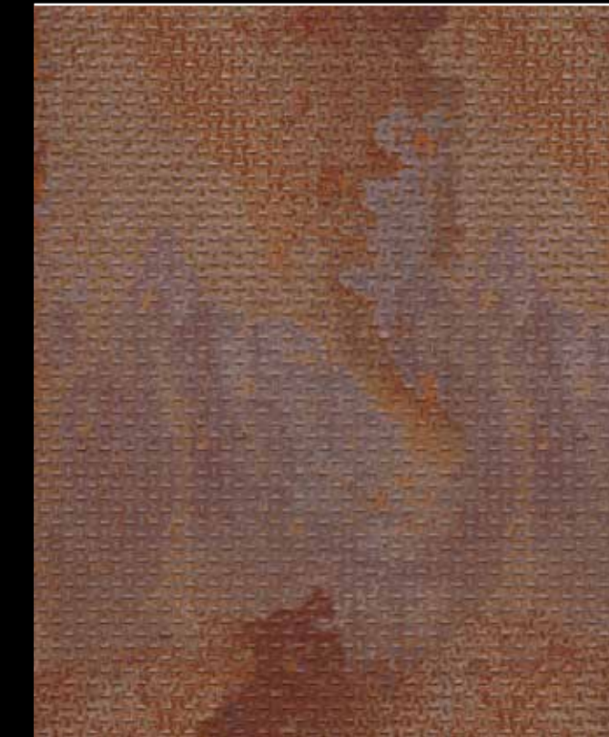
Factory # K106

Stärke Thickness: 4 mm Format Format: 2.600 x 1.220 mm Inhalt Content: 1 Stück/Karton pcs/box (3,17 m 2 )