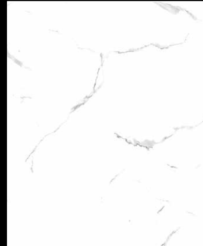
Mud # K101

Stärke Thickness: 4 mm Format Format: 2.600 x 1.200 mm Inhalt Content: 1 Stück/Karton pcs/box (3,12 m 2 )