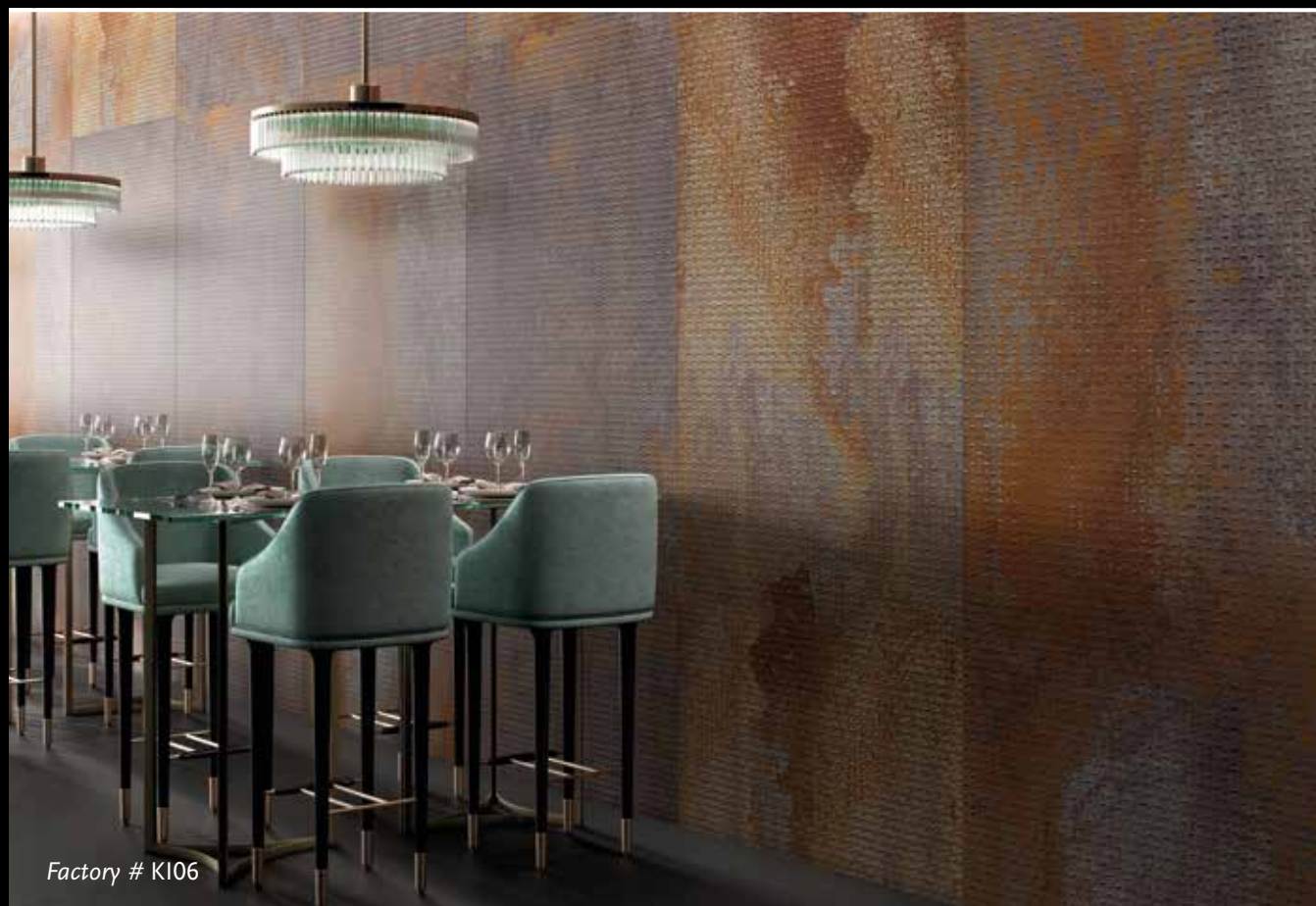
Factory # K106