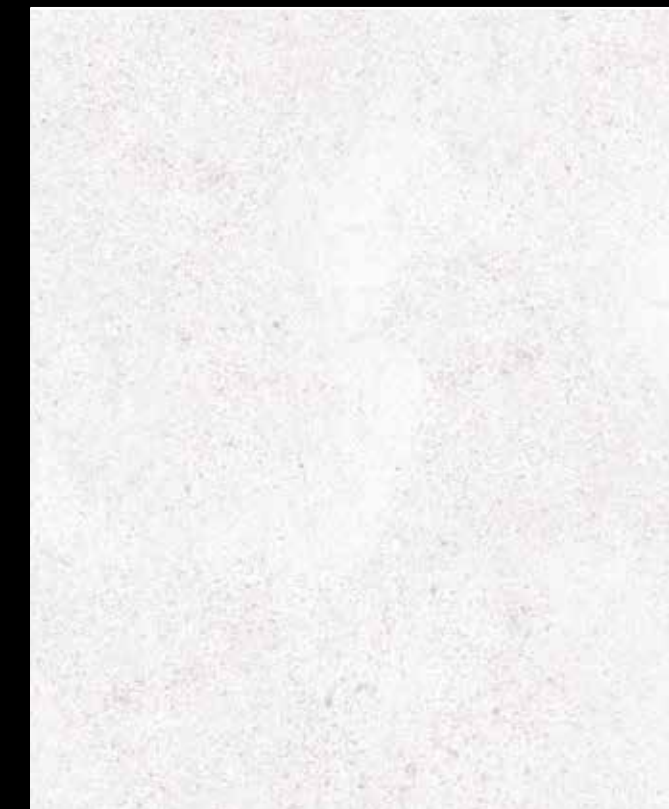
Verona White # K135