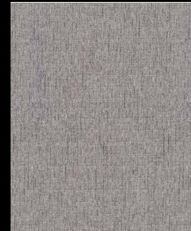
Fluffy # K107