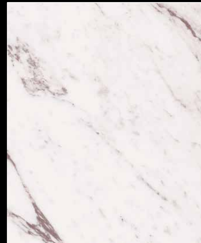
Versilia # K130