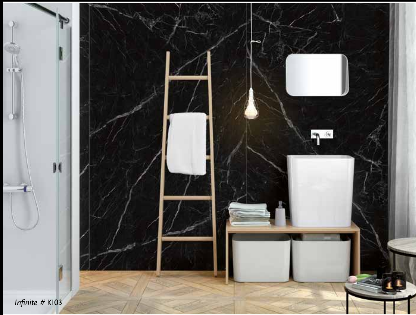
Infinite # K103