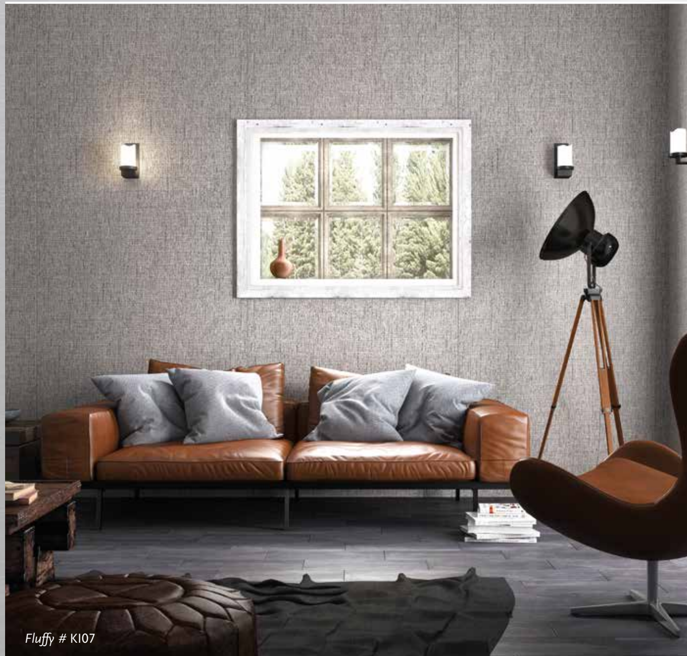
Fluffy # K107

© HWZ International AG Switzerland. Sämtliche Abbildungen können farblich vom Originalprodukt abweichen. All pictures may differ in color from the original product. 10520514/6 / 122019