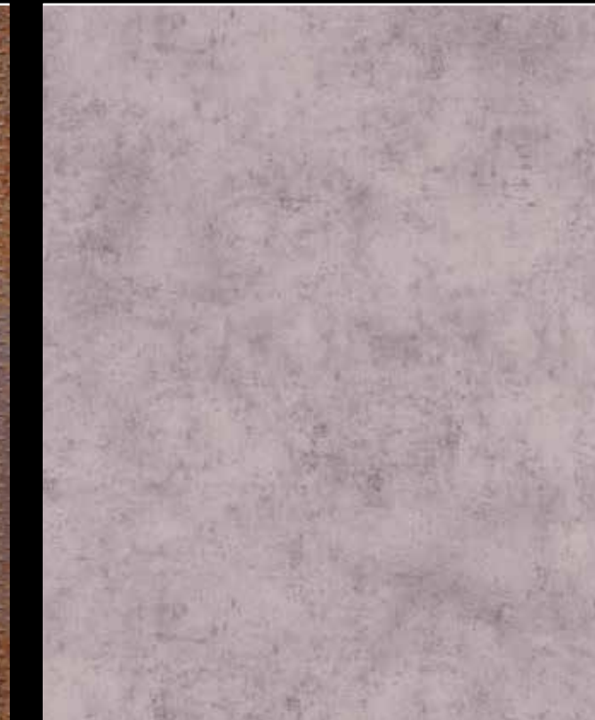
Chronic # K109