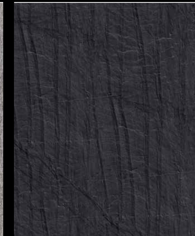
Manson # K111